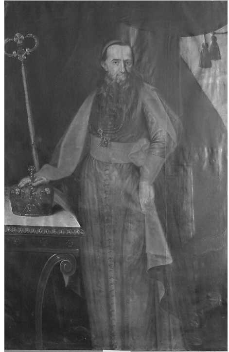
6. kép. Franz Linder (1736–1806): Bacsinszky András püspök (1773–1809) portréja, 1792. Ungvár, Kárpátaljai Megyei Boksay József Művészeti Múzeum