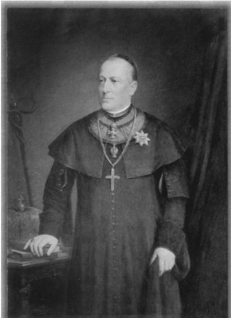
7. kép. Zaborai János (1835–1909): Pankovics István püspök (1864–1874) képmása, 1877. Ungvár, Kárpátaljai Megyei Boksay József Művészeti Múzeum