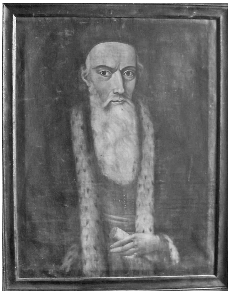
1. kép. Spalinszky Mihály(?): De Camillis József munkácsi püspök (1689–1706) portréja, 1767 körül. Ungvár, Kárpátaljai Megyei Boksa József Művészeti Múzeum