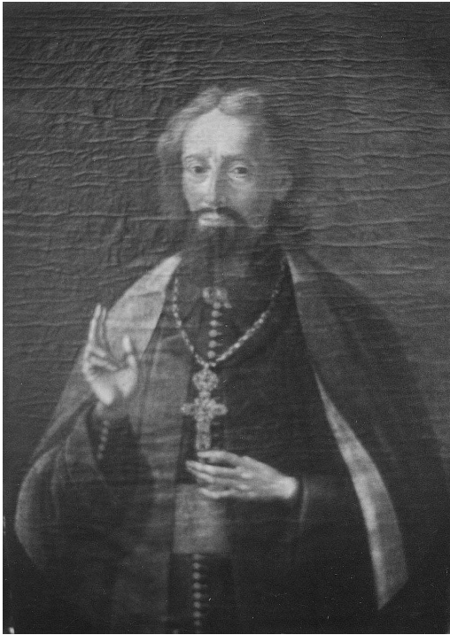
4. kép. Spalinszky Mihály(?): Olsavszky Mánuel munkácsi püspök (1743–1767) arcképe, 1767 előtt. Ungvár, Kárpátaljai Megyei Boksay József Művészeti Múzeum