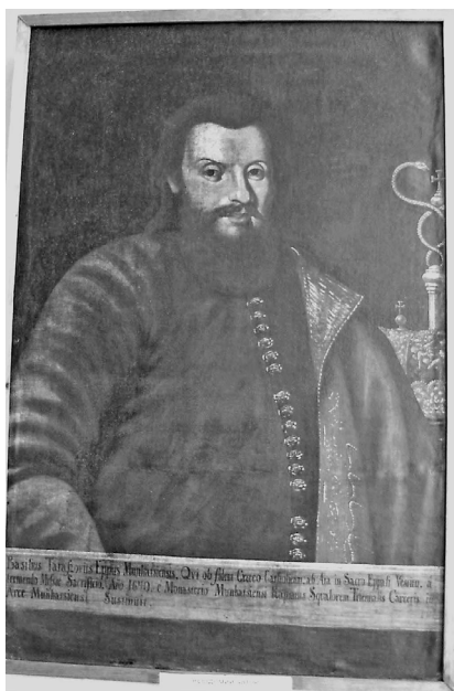
2. kép. Ismeretlen magyarországi festő: Taraszonius Bazil munkácsi püspök (1633–1651) arcképe, 1643–1648 között. Ungvár, Kárpátaljai Megyei Boksay József Művészeti Múzeum