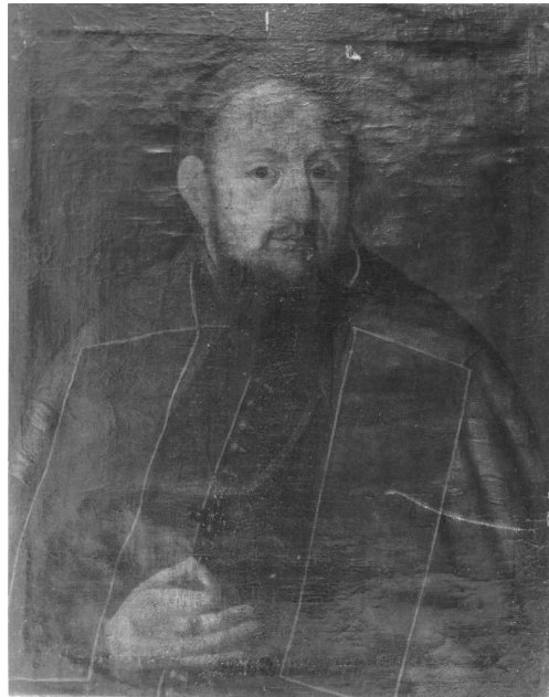
5. Ismeretlen festő: Blazsowszky György munkácsi püspök (1738–1742) állítólagos arcképe, 18. század. Ungvár, Kárpátaljai Megyei Boksay József Művészeti Múzeum