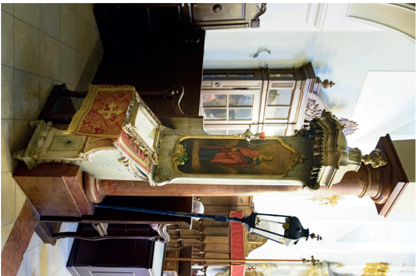
6. kép: Proszkinitárium az Istenszüllő ábrázolásával, 1770-es évek. Szentendre, szerb székesegyház. Fotó: Jaksity Iván, 2015