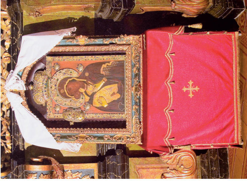
17. kép: A vinčai-bezdini Istenszülő ikonja, 1748. Karlóca, Szent Miklós-székesegyház. Јањушевић-Николић 2010 nyomán