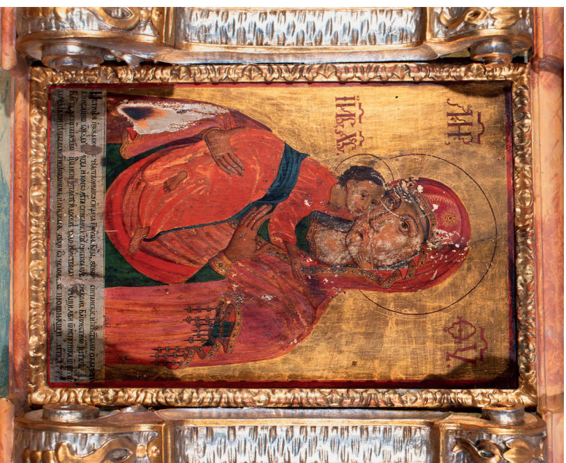
18. kép: A vinčai Istenszüllő ikonja, 1747. Révkomárom, ortodox templom.