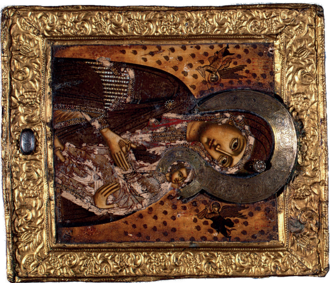
3. kép: A Szenvedő Istenszülő ikonja. Révkomárom, ortodox templom. Fotó: Jaksity Iván, 1999