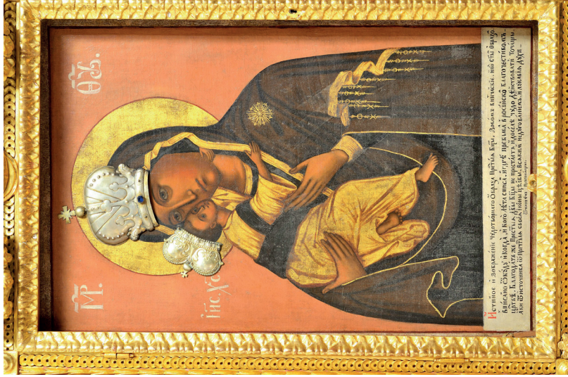
20. kép: A vinçai-bezdini Istenszülő ikonja, 1786 után. Grábóc, szerb monostortemplom.