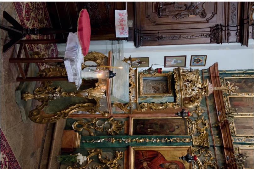
2. kép: Proszkinitáron a Szenvedő Istenszülő ikonjával, 1760-as évek. Révkomárom, ortodox templom.