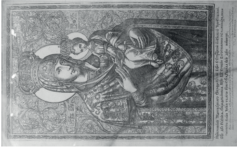
13. kép: A csernyigovi Iljinszkaja Istenszüllő, 1725. Rézmetszet. Szentendre, Szerb Ortodox Múzeum. Fotó: Jaksity Iván, 2015