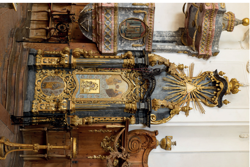
23. kép: Az egeri ortodox templom Istenzüllő-trónja, 1789–1794.