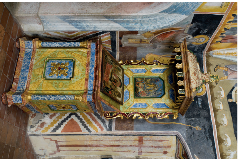
10. kép: Proszkinitárió, 1760–1761. Ráckeve, szerb ortodox monostortemplom.