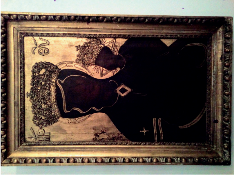
25. kép: A brünni Mária-kegykép másolata, 19. század (?). Budapest, szent ortodox templom. Fotó: Jaksity Iván, 2017