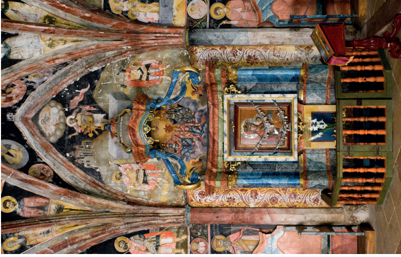
9. kép: Istenszülő-trón, 1760. Ráckeve, szerb ortodox monostortemplom. Fotó: Jaksity Iván, 2015