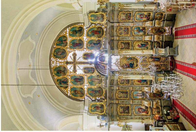
5. kép: A szentendrei szerb székesegyház entériője.