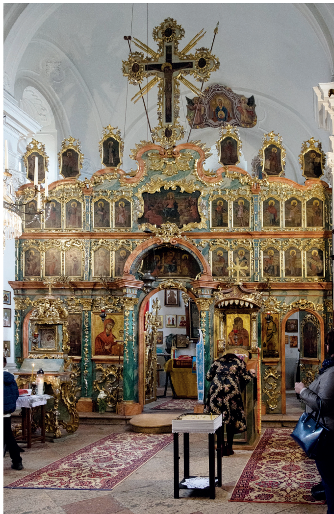
1. kép: A révkomáromi ortodox templom enteriőrje. Fotó: Jaksity Iván, 2017