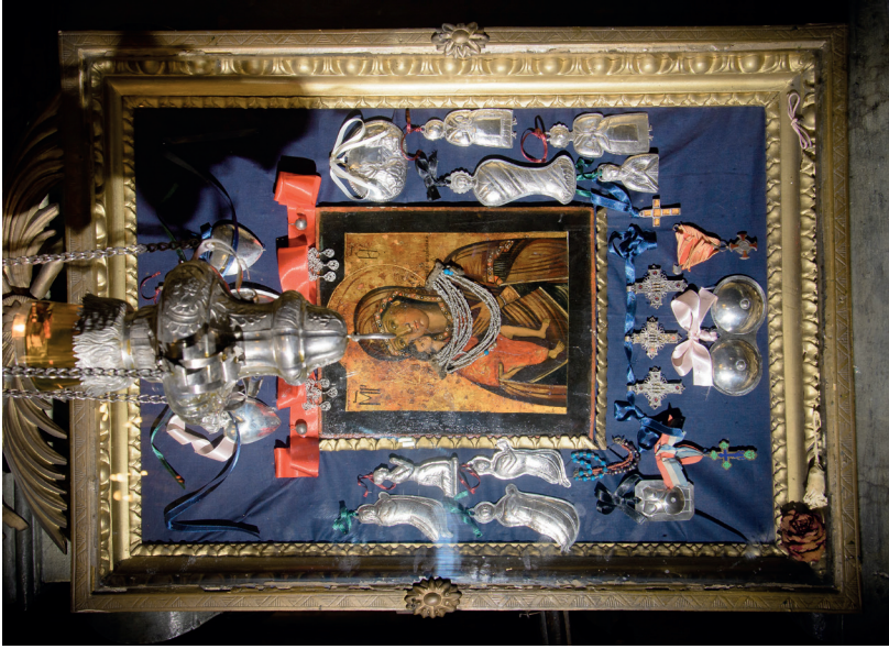
8. kép: A Fiodorovszkaja Istenszülő ikonja, 18. század. Szentendre, szerb székesegyház. Fotó: Jaksity Iván, 2015