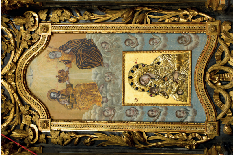
24. kép: Az egri ortodox templom Istenszüelő-trónja, részlet, 1789–1794. Fotó: Jaksity Iván, 2016