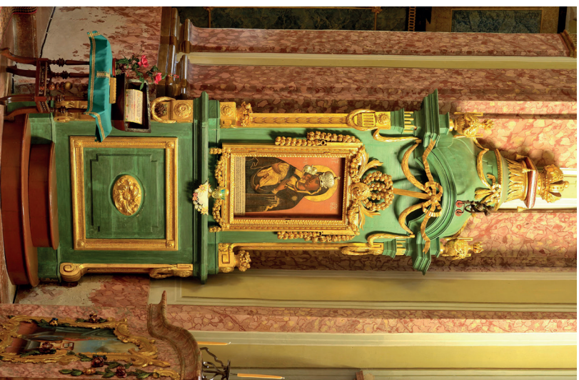
19. kép: A grábóci szerb monostortemplom Istenszüllő-trónja, 1780-as évek.