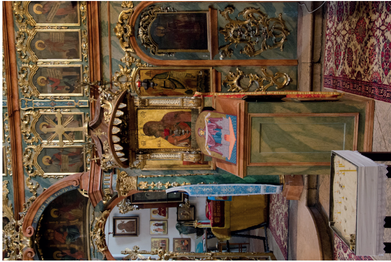
4. kép: Proszkinitárium a vinčai Istenszüelő ikonjával, 18. század vége. Révkomárom, ortodox templom. Fotó: Jaksity Iván, 2017