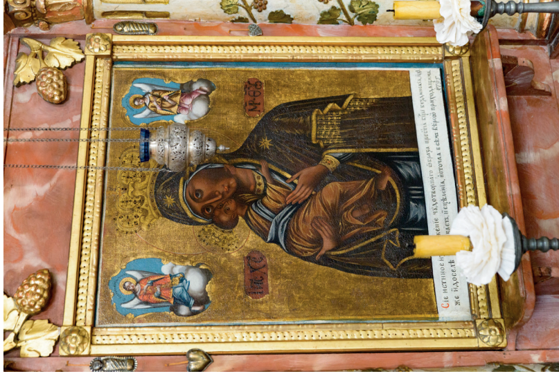
21. kép: A vinçai-bezdini Istenszülő ikonja, 1795. Hódmezővásárhely, ortodox templom.