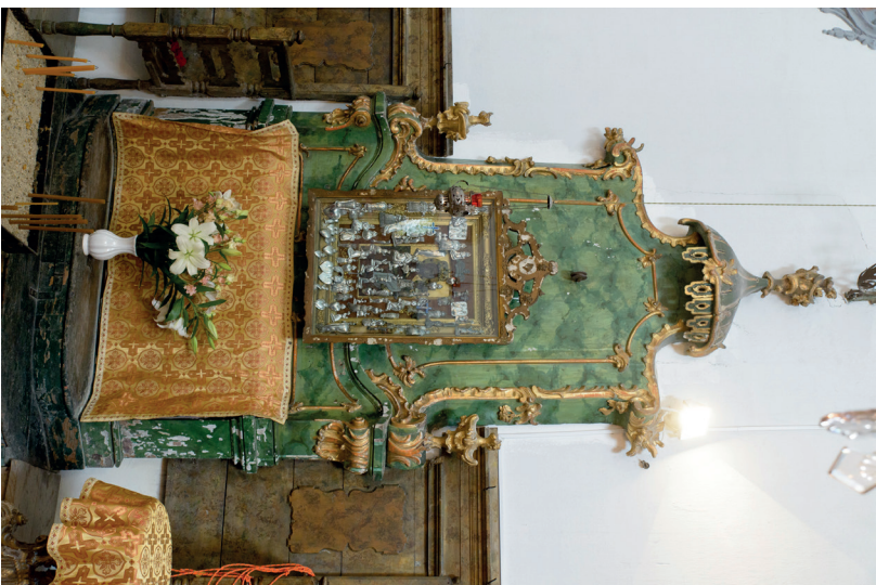
15. kép: Istenszüllő-trón, 1784–1786 után. Szentendre, Preobrazsenszka templom.