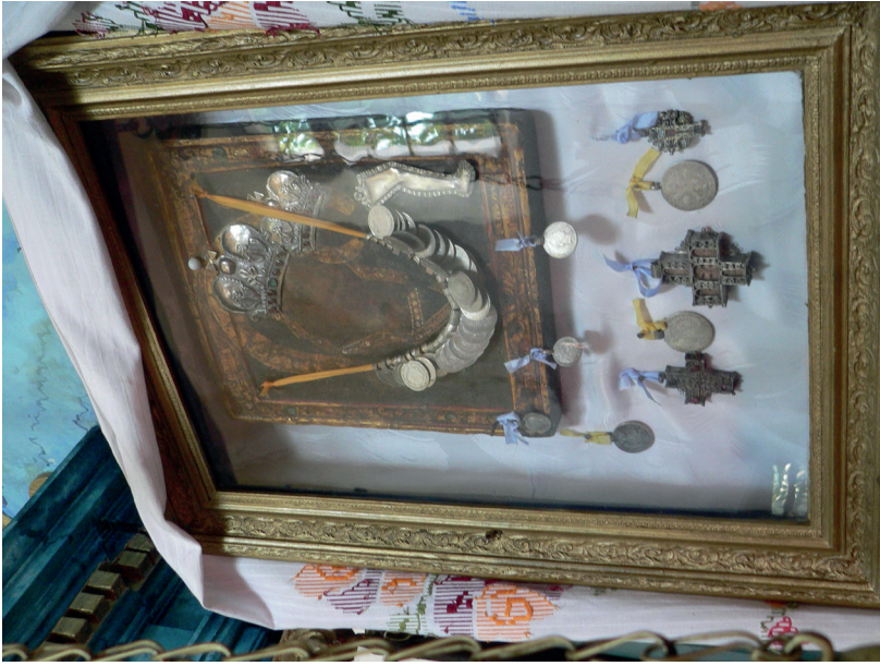
16. kép: Kazányi Istenszülő-ikon, 18. század. Csobánka, szerb templom. Fotó: Jaksity Iván, 2015