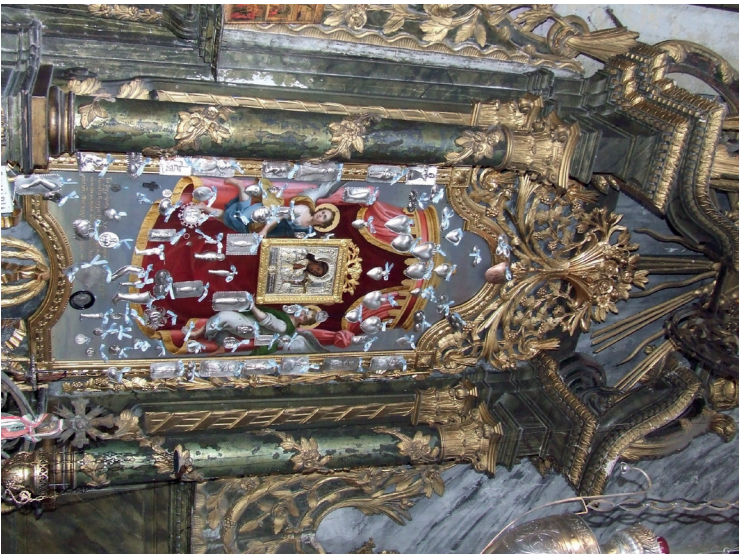
22. kép: A miskolci ortodox templom Istenzüllő-trónja, 1807.