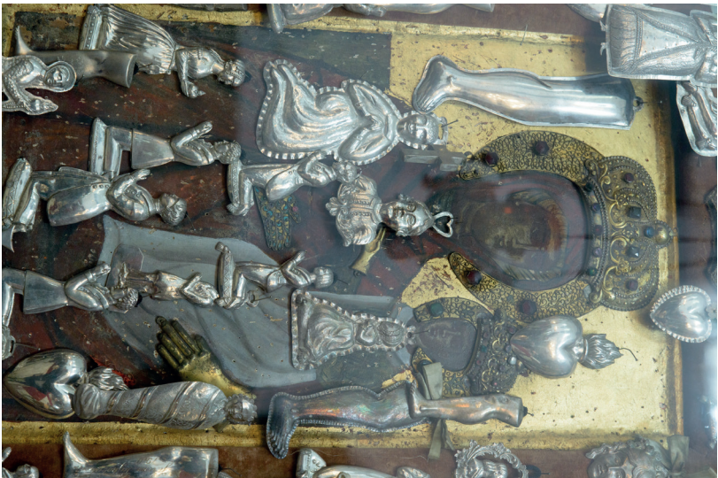
14. kép: A szentendrei Preobrazsenszka templom csodatévő Istenszüllő-ikonja, 17. század vége (?).