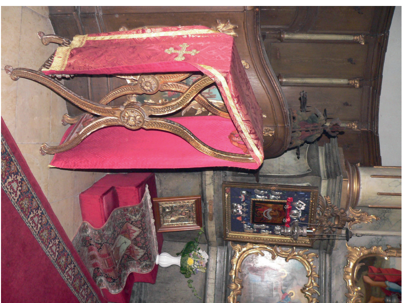
7. kép: A szentendrei szerb székesegyház „Istenszüllő-trónja”. Fotó: Jaksity Iván, 2015