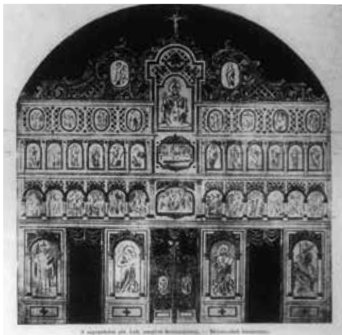
A szentmunkákhoz tartozó szentmunkákhoz tartozó.