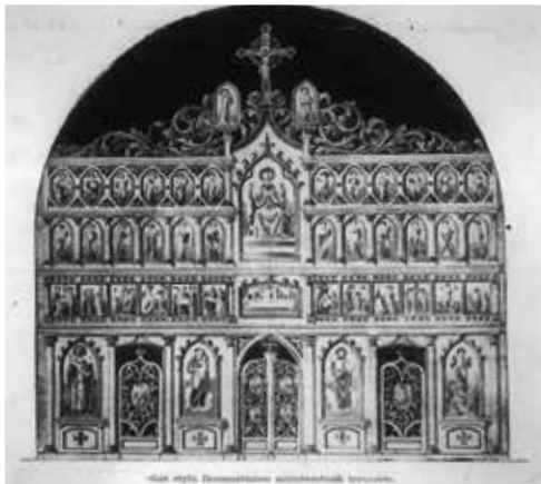
Magyar nyelvű szentmunkák szentmunkáihoz tartozó.