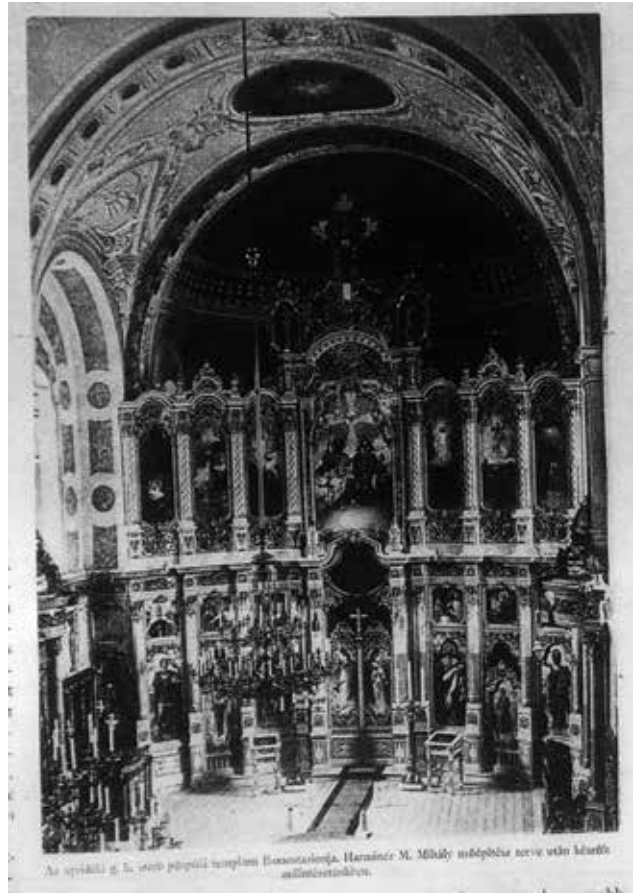
As a typical of the style of the temple in Constantinople, the interior of the Holy Sepulchre is a masterpiece of architecture.